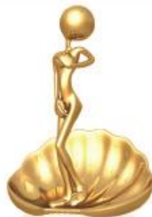
BEAUTY & SPA